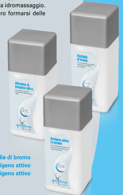
Pastiglie di bromo Granulato di ossigeno attivo Attivatore di ossigeno attivo

Utilizzare i biocidi in sicurezza. Prima dell'uso leggere sempre l'etichetta e la scheda informativa del prodotto.