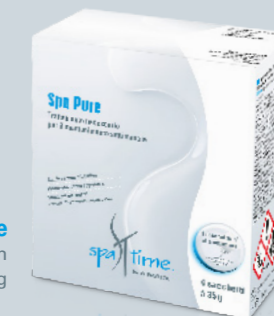
Spa Pure Cartone con 4 sacchetti à 35 g

Questo prodotto è applicabile con tutti e tre i metodi di cura, cloro, senza cloro con base di ossigeno attivo o bromo.