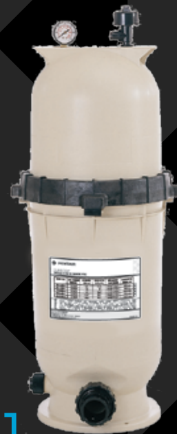
Clean &amp; Clear