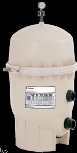
Clean &amp; Clear Plus